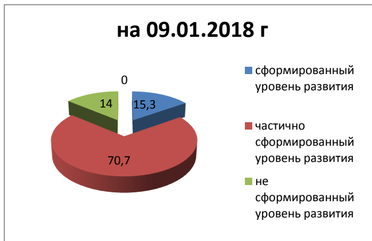
Диаграмма уровня сформированности развития воспитанников за 2018 год (средний показатель)