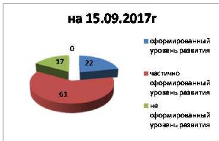
Диаграмма уровень сформированности развития воспитанников 2017-2018 учебный год (средний показатель)