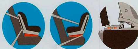
Лицом по ходу движения